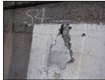
鉄筋の露出 (塩浜地区)