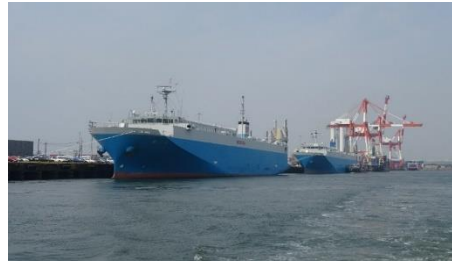
W24,W25 岸壁 (自動車運搬船 あさか、さやま)