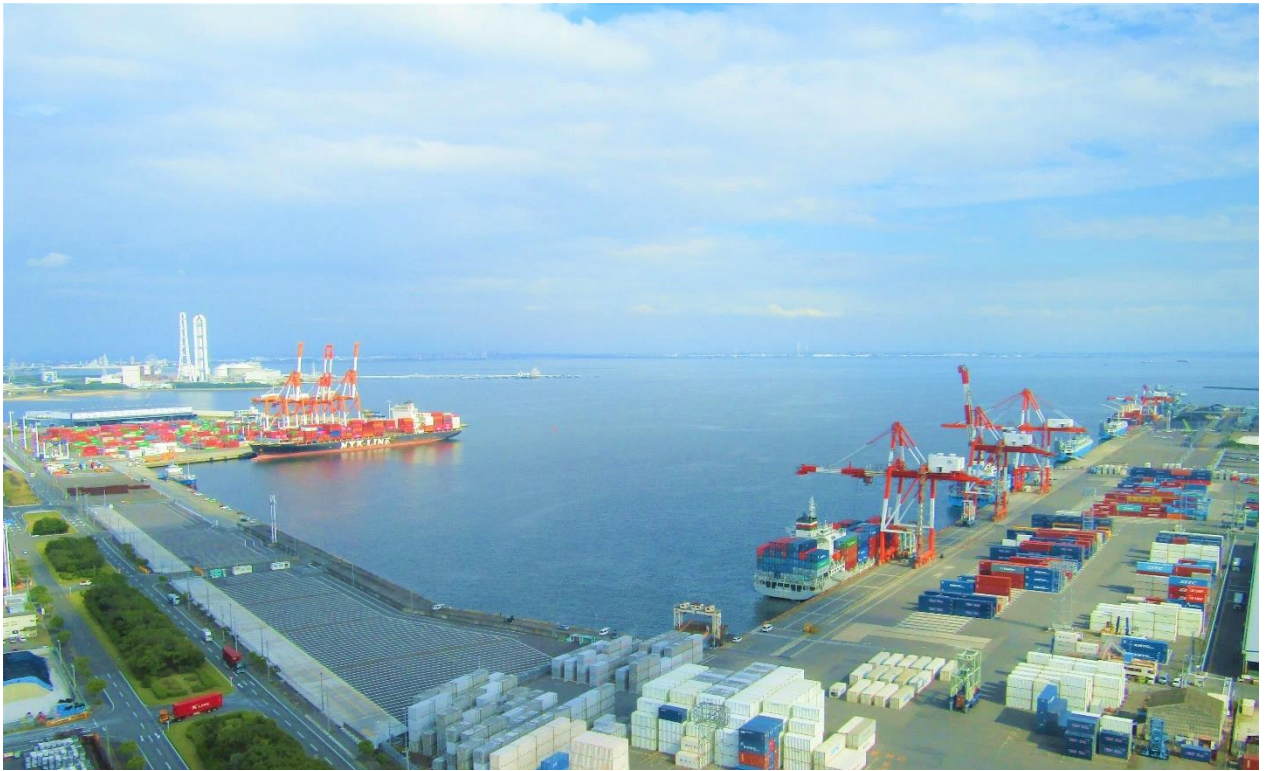
霞ヶ浦地区の利用状況