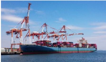
W80 岸壁 (コンテナ船 SEASPAN EMINENCE)