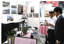
〈昨年の当所合同ブース〉