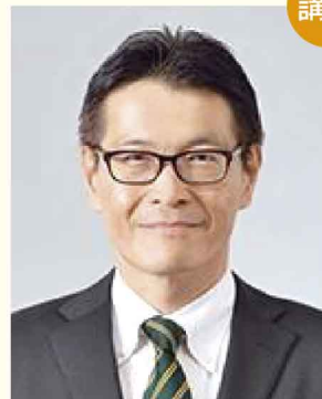
イオンリテール株式会社 執行役員 人事・総務本部長