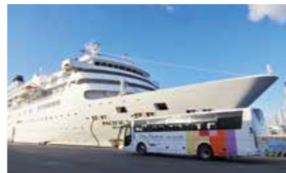
四日市港(千歳町)で

11/19 クルーズ船 ばしふいつくびいなす 入港 横浜港発・大阪港着「秋の伊勢 四日市・大阪クルーズ」の一環で四日市港四日市地区(千歳町)に寄港。乗船客は四日市の中心市街地をはじめ、紅葉の見ごろを迎えた御在所観光など当地ツアーを満喫。船内での地場産品販売ブースでは土産物に萬古焼やしぐれ煮を購入するなど、四日市での滞在を楽しんだ。