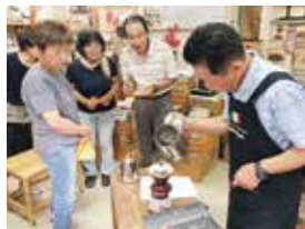
究極のアイスコーヒーの淹れ方を指導する店主(右)=諏訪栄町で