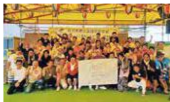
交流会に参加した会員ら

三重県商工会議所連合会... 8月8日、アクサ生命保険(株)四日市支社と合同で第8回県連共済増強キャンペーン表彰式を津市で開催。