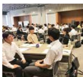
ロールプレイでマナーを学ぶ新入社員ら=当所で

今年4月入社の新入社員や若手社員50人を対象に、入社後の振り返りから、今後のステップアップのポイントまで専門講師が指導。ビジネスマナー定着度やクレーム処理の基本手順などロールプレイを交えて学んだ。同セミナーは9月26日にも開催する。