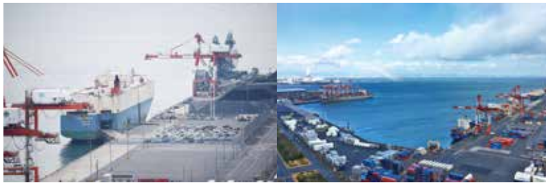
④ 四日市港外貿コンテナ取扱個数

明治32（1899）年に貿易ができる港として開港した四日市港。市内で生産された生糸の輸出に始まり、綿花、羊毛の輸入港から、昭和の高度成長期のコンビナート形成に伴い工業港へと変貌。さらに貨物のコンテナ化に対応し、コンテナ貨物やLNG（液化天然ガス）、石炭、完成自動車など取り扱う国際拠点港湾として成長を続ける四日市港を紹介した。