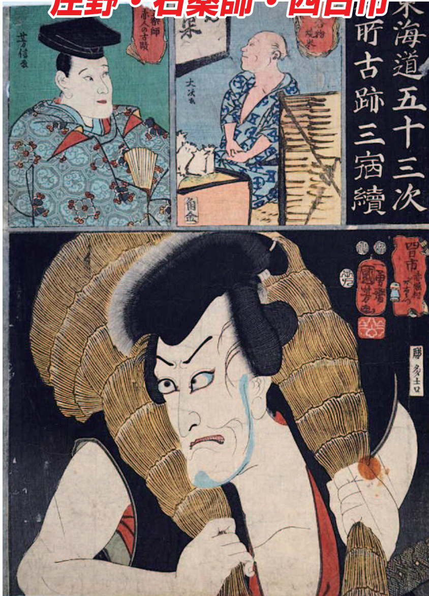
歌川国芳筆 嘉永五(1852)年版

本シリーズは、三つの宿場それぞれにゆかりのあるものが描かれ、四日市は、庄野、石薬師と一組になっている。本品は、残念ながら最上部が切り取られている。