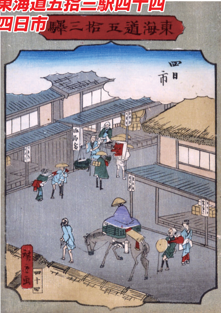
二代 歌川広重(立祥) 筆

四日市を描いた浮世絵の多くは、蜃気楼や追分の鳥居そして橋を描いたものに偏り、宿場のにぎわいを描いたものは本作品の外に見つかっていない。