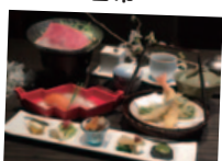
三重県産 黒毛和牛すき焼き御膳 (1,800円サ税込)