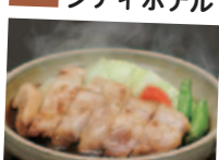
陶板焼きトンテキ・煮物茶碗蒸し (1,650円サ税込)