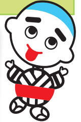
四日市のゆるキャラ こにゅうどうくん