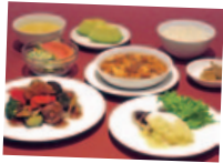
四日市産 さくらボークの四川風 (2,300円サ税込)