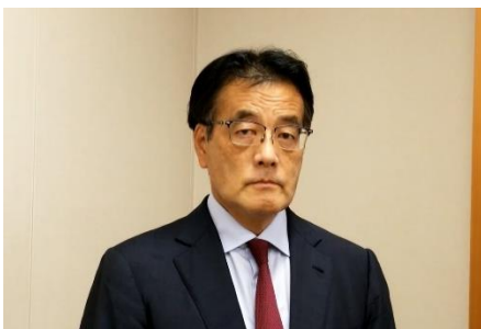
岡田克也 衆議院議員