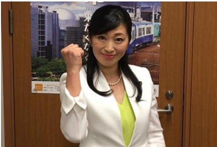
吉川ゆうみ 参議院議員