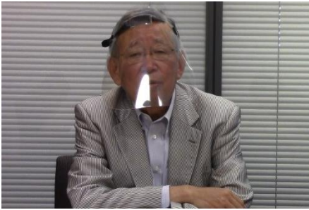
川崎二郎 衆議院議員