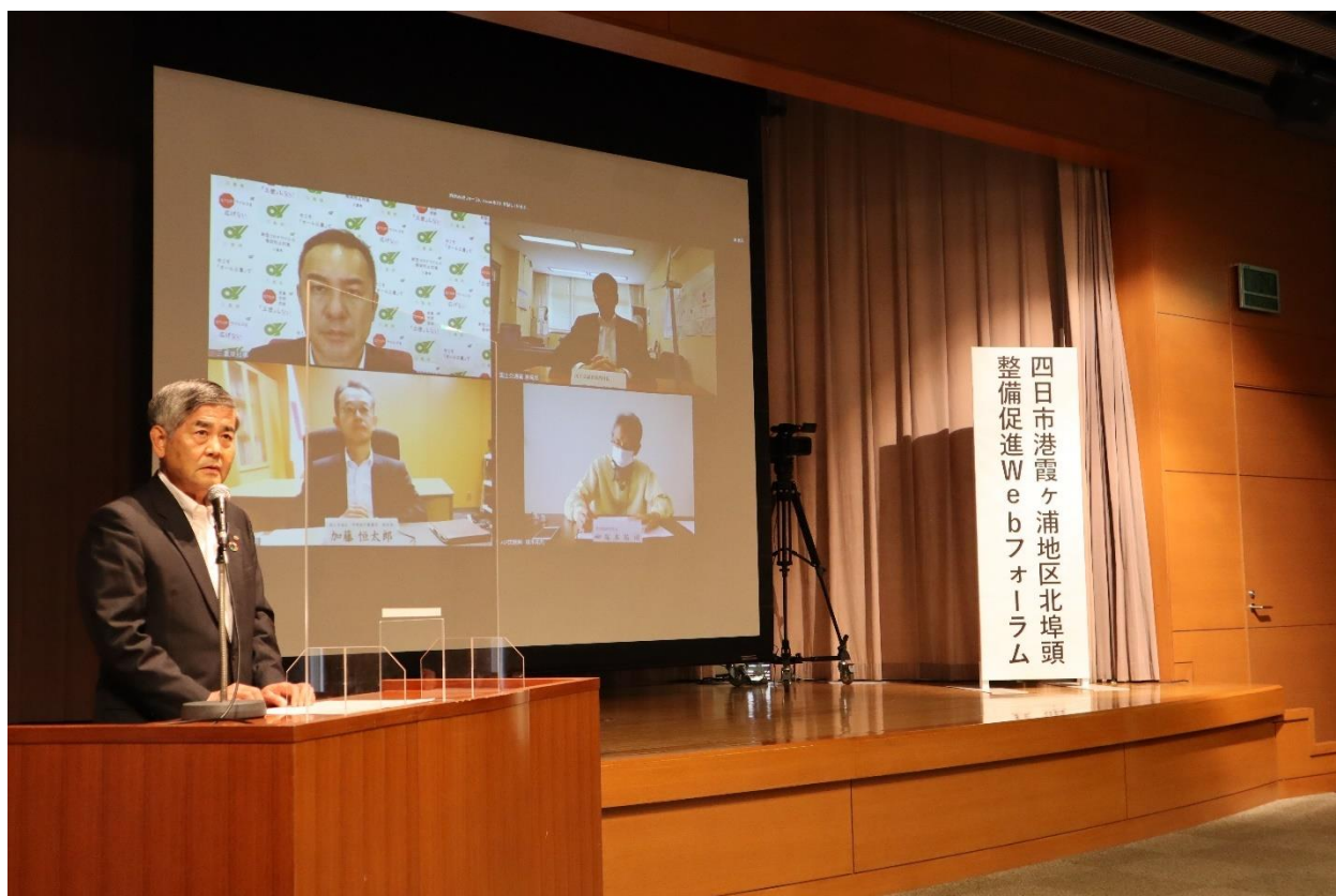
Web フォーラムの様子